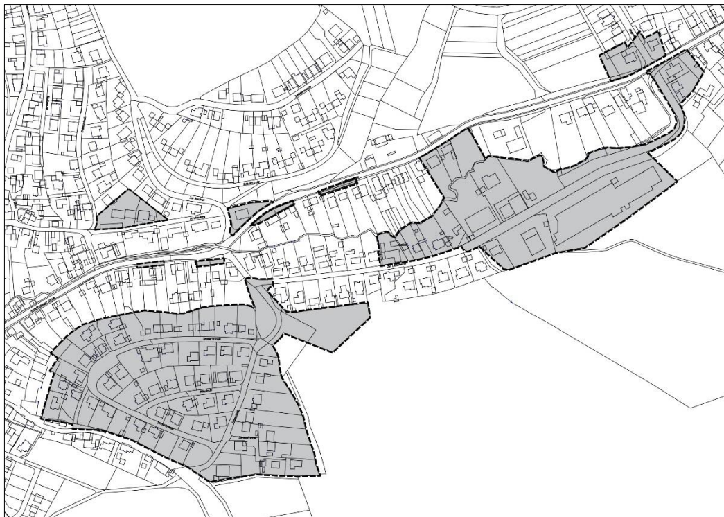
Geltungsbereich Bebauungsplan "Felgen und Hirtenwiese"

Stand: 2019-10-24 | Bearbeiter: M.Sc. Frederic Hattenbauer